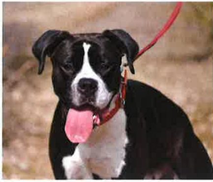
Dom, adoptat de Sa Coma