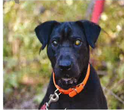
Aretha, cadella cega adoptada de Sa Coma

Gràcies a la FUNDACIÓ GOSSES, Coco ha trobat una família fantàstica a Suïssa, després de molts anys esperant en una gàbia en Sa Coma, COCO ha estat adoptat.