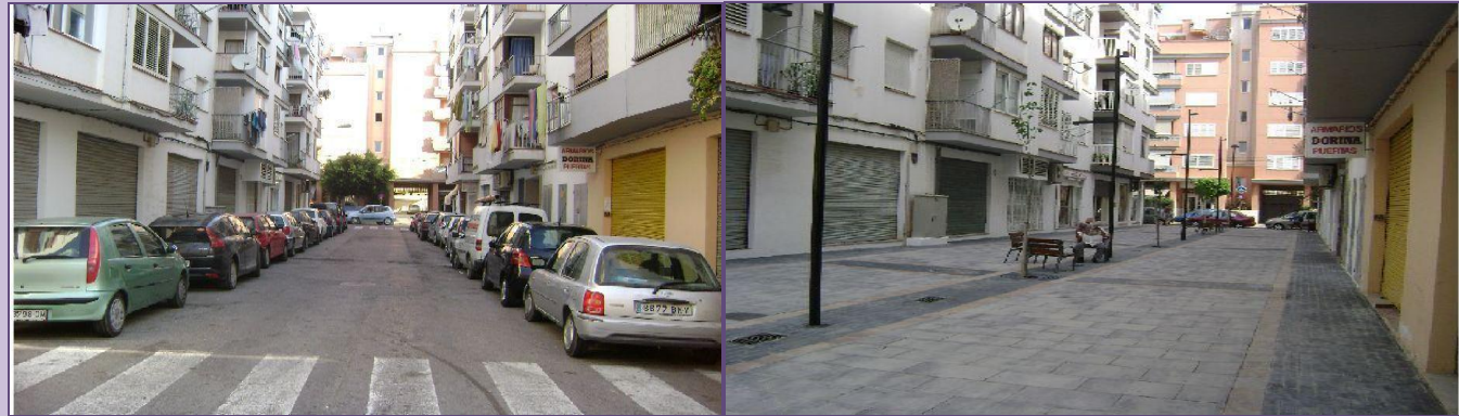
Abans de les obres

manera que siguin més adequades i transitables, acomplint amb la normativa vigent en Supressió de Barreres Arquitectòniques.