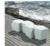
B4. BANCÓ TIPO 'SARRO'