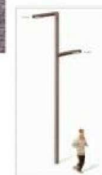
F1. FAROLA TIPO BAE BASIC 1m