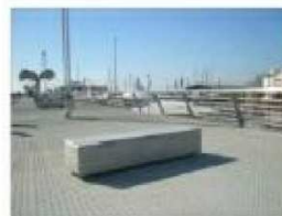
B1. BANCOS TIPO "NAGULAR"