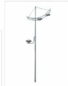
F2. FAROLA TIPO GONDOLA 18