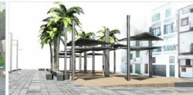
I. IMAGEN VIRTUAL