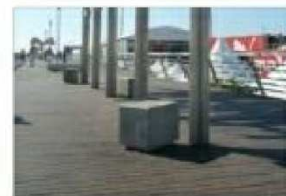
B2. BANCOS TIPO "GR"