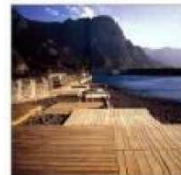
S. ENTARIMADO DE MADERA SINTÉTICA