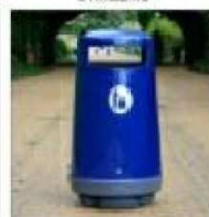
P2. PAPELEIRA TIPO ST