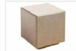
B3. BANCÓ TIPO 'CLUB'