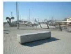
B1. BANCÓ TIPO 'MIGOLLAR'