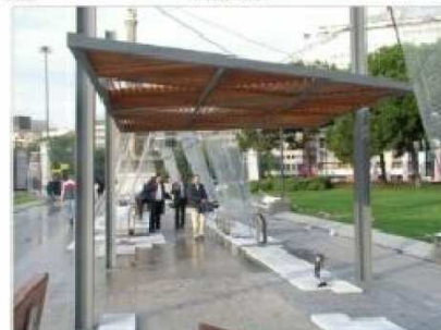
P1. PERGOLA TIPO 'ALAMEDA'