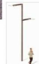
F1. FAROLA TIPO DAI BASIC 18