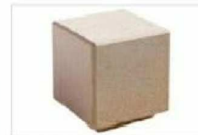
B3. BANCOS TIPO "CUBO"