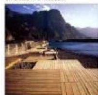
S1. ENTARIMADO DE MADERA SINTÉTICA