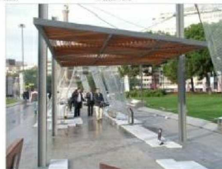
S3. PERGOLA TIPO ULAIREN