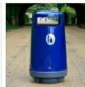
PF. PAPELERA FORST