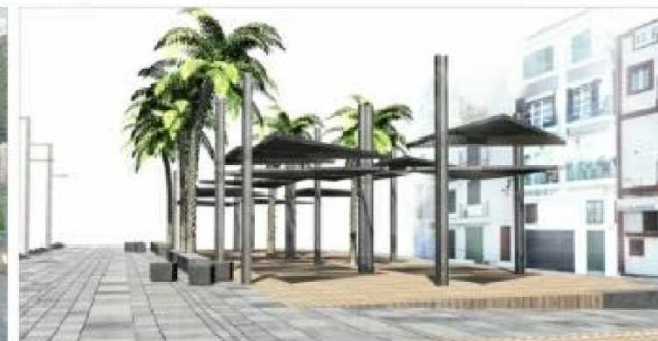
S4. MASCA VIRTUAL