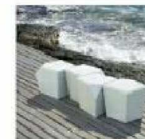
B4. BANCOS TIPO "CUARZO"