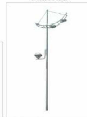
F2. FAROLA TIPO GÓNDOLA 10m