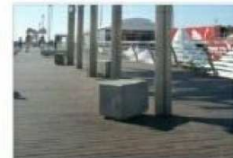
B2. BANCÓ TIPO 'DIP'